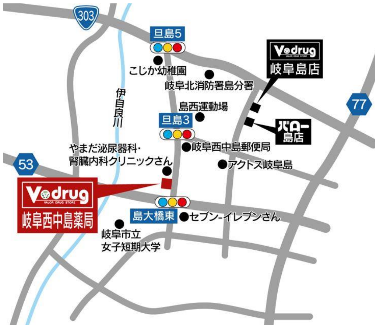
岐阜西中島薬局 地図