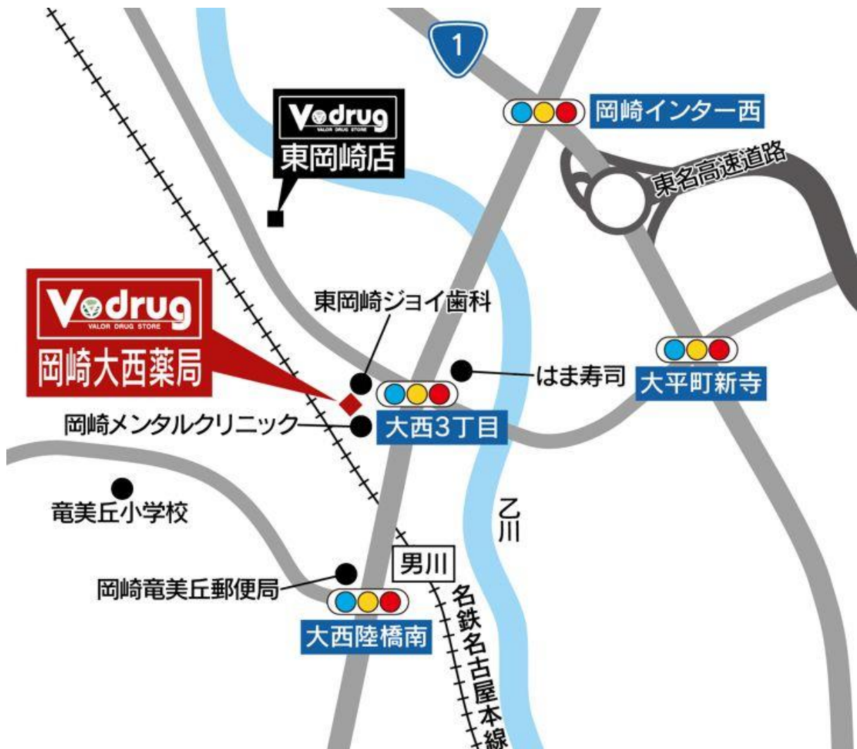
岡崎大西薬局 地図