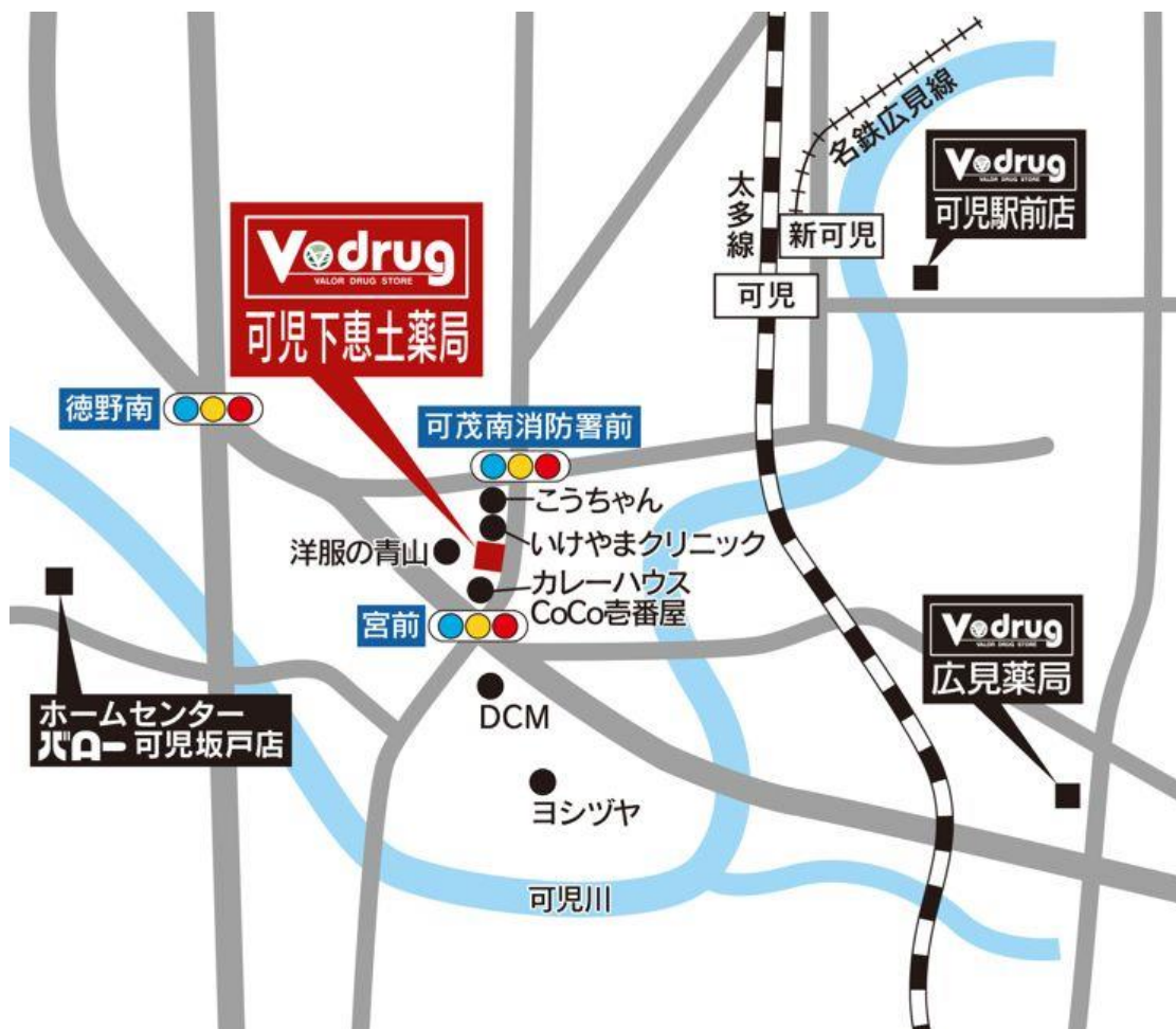
可児下恵土薬局 地図