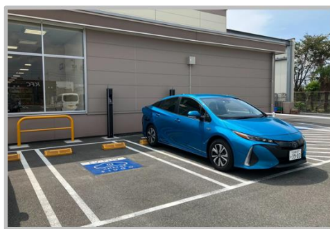
バローグループの再エネ普及の取り組み