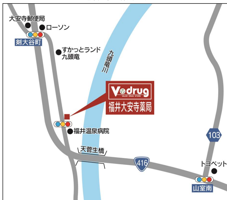
福井大安寺薬局 地図